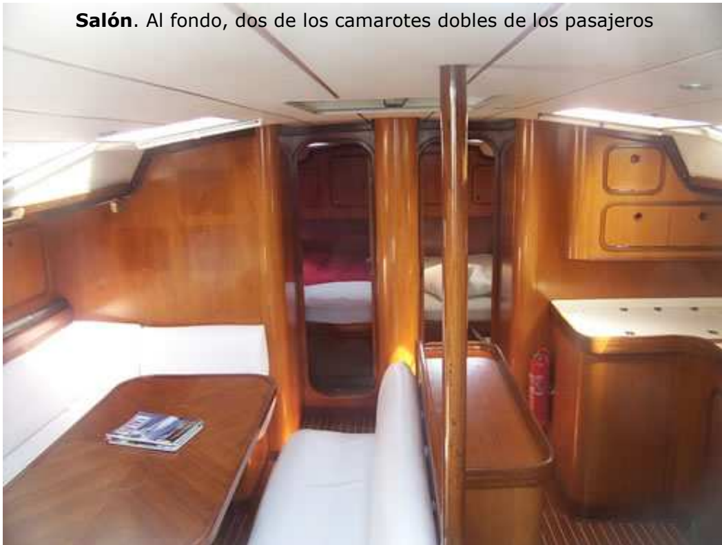
Salón. Al fondo, dos de los camarotes dobles de los pasajeros